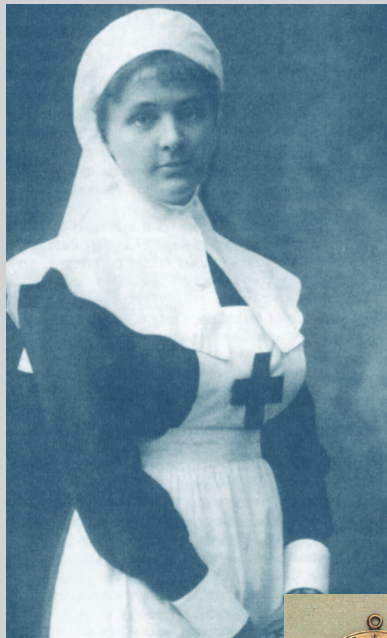
Сестра милосердия одной из общин РОКК. Начало XX в.

Так Дюнан оказался в бедности. Родня из милости высылала ему денежную помощь из расчета 3 франка в день — благодаря этому Дюнана взяли на жительство в больничный приют в Хайдене, где